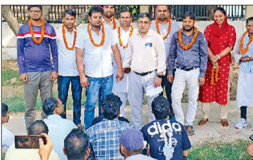
नारनौल। बैठक में भाग लेते कार्यकारिणी के सदस्य।