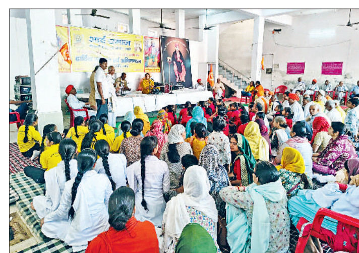
रेवाड़ी। आर्य समाज के महोत्सव में मौजूद बुद्धिज्जान।