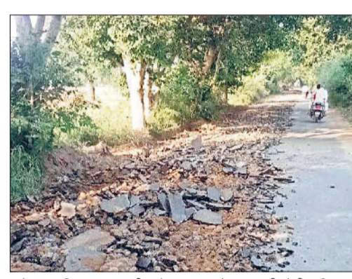
महेंद्रगढ़। विभाग द्वारा बुडीन से बलाघाटा मोड़ तक की तोड़ी गई सड़क।

4.44 करोड़ की लागत से खातोद तक बनाई जाएगी नई सड़क. राजस्थान से मजबूत होगी जिले की कनेक्टिविटी