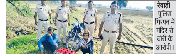
रेवाड़ी। पुलिस गिरफ्तार में मंदिर से चोरी की आरोपी।