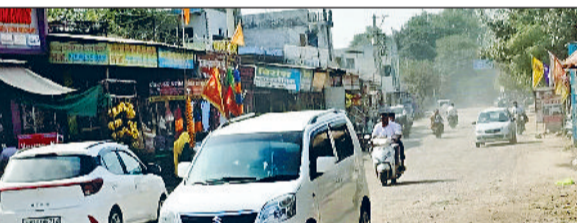
रेवाड़ी। बेरली कलां बस स्टैंड के पास टूटी सड़क पर उड़ती हुई धूल।