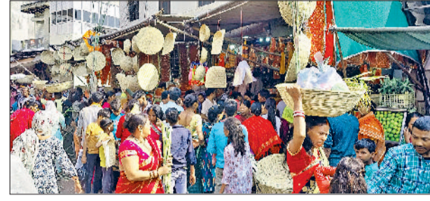
छठ पूजा को लेकर सामग्री खरीदती महिला व छठ पूजा को लेकर सोलहराही तालाब में बनाया गया कुत्रिम घाट, नाईवाली सब्जीमंडी में पूजन सामग्री खरीदने के लिए लगी भीड़।