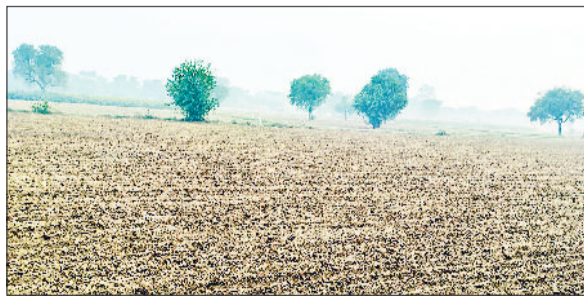
रेवाड़ी। सरसों की बिजाई के बाद खेत।

गया। हवा में नमी का स्तर 40 प्रतिशत तक रहा, जबकि हवाओं की रफ्तार 6 किलोमीटर प्रति घंटा रही। तापमान गिरने से रात के समय ठंड का असर बढ़ना शुरू हो गया है। दिन के समय धूप अब शरीर को चुभना बंद हो गई है। गत वर्ष की तुलना में इस बार ठंड की शुरुआत पहले हो रही है। बीते वर्ष 26 अक्टूबर को अधिकतम तापमान 35.0 डिग्री और न्यूनतम 17.0 डिग्री सेल्सियस दर्ज किया गया था।