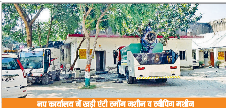
नगर कार्यालय में सड़की एंटी स्मॉग मशीन व स्वीपिंग मशीन

प्रदूषण का स्तर बढ़ने से लोगों को आंखों में जलन व सांस लेने में कठिनाई महसूस हो रही